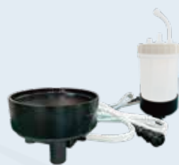
MOOYU-O 圆形耐腐蚀加热板